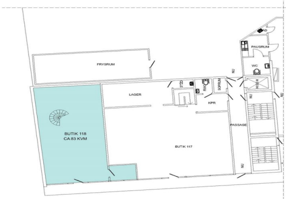
PLAN 1 (ENTRÉPLAN)_CA 83 KVM

KITNING OCH MALIT BÄSTÄLLS PÅ ENT ORIGINELL VISS AVFÄLLISSE FÅR DANFORS FÖRETAGEN.M.V.